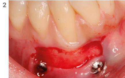
Relleno con dentina.