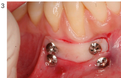
Perfecta tolerancia de los tejidos blandos.